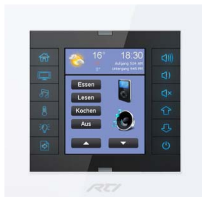
Das neue, sehr kostengünstige Panel erlaubt auch, eine zentrale Musikanlage zu steuern.

Genauso einfach erfolgen Änderungen. Schliesslich merkt man erst mit der