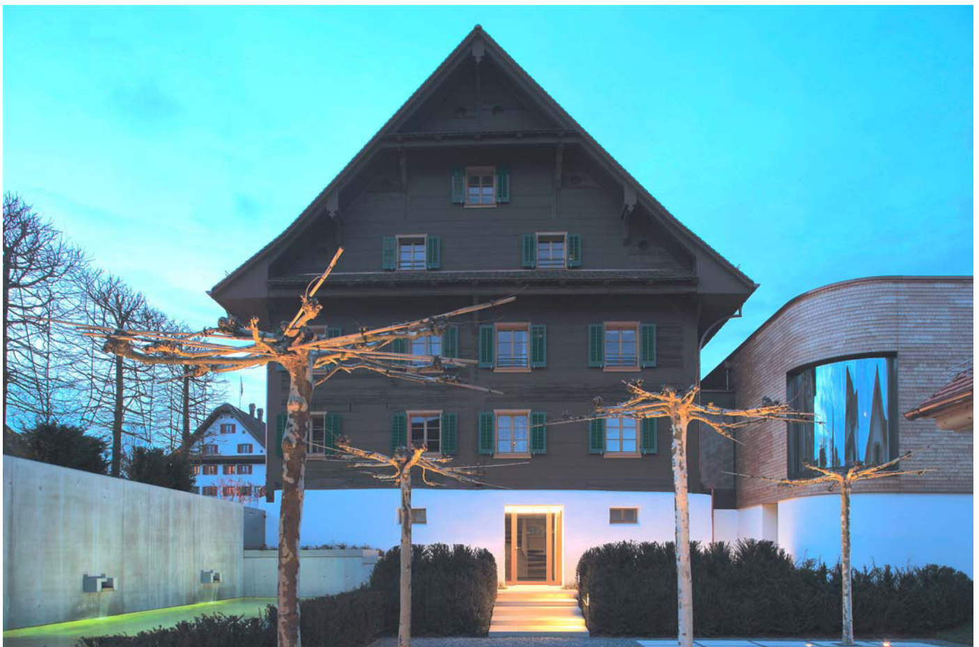
Fast 500 Jahre altes Bauernhaus, wunderbar restauriert und mit neuester Technik ausgerüstet.

Um dieses Haus für moderne Wohnansprüche aufzurüsten, gelangten sehr aufwendige Techniken zum Einsatz. Beispielsweise mussten sowohl das Haupt- wie auch das Gästehaus in aufwendigster Handarbeit und unzähligen Etappen komplett mit Beton unterfan-