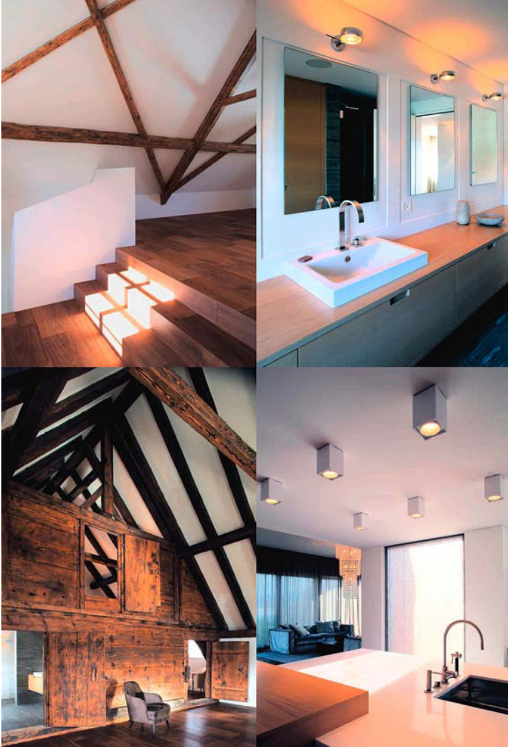
Einblicke ins Treppenhaus, ins Bad im OG, in den ausgebauten Dachstuhl und ins Wohnzimmer im Erdgeschoss.

über Smartphone oder Internet gesteuert werden kann.