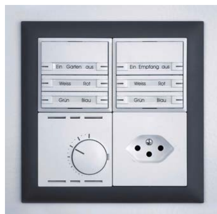
Storen, Licht, Heizung, Lüftung usw.: Alles mit NOXnet über elegante Elektronikaster steuern.

NOXnet steuert, was Sie wollen: Licht, Rollläden, Markisen, Dachfenster, Heizungs- und Lüftungsanlagen, Ventilatoren, Vorhänge, Musikanlagen, Alarmanlagen usw. Anstelle von unterschiedlichen Licht-, Dimmer-, Storenschaltern, Raumthermostaten, Zeitschaltuhren usw. werden elegante Elektronikas-