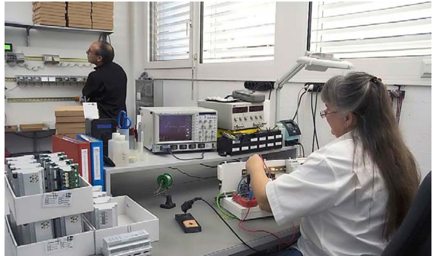
Keine Baugruppe verlässt ungeprüft den Betrieb.

NOXnet wurde speziell für den Wohnungsbau entwickelt. Deshalb ist das System übersichtlich, leicht zu planen und zu installieren. Einfach ist auch die Konfiguration mit der selbst entwickelten PC-Software NOXlink, die für den Elektroinstallateur und den Bauherrn kostenlos ist. Wer sich in der PC-Welt einigermaßen auskennt, kann ohne lange Schulung innert kürzester Zeit