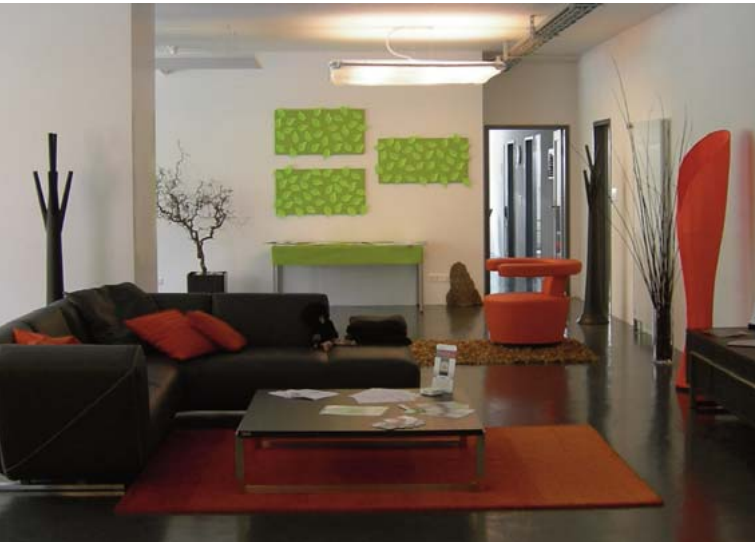
Der Showroom in Heimberg – Anmeldung unter 033 345 28 00

Pünktlich zum Jubiläum hat die in Uetendorf ansässige INNOXEL System AG in Heimberg einen Showroom für ihr Gebäudeautomations-system NOXnet eingerichtet, das sie seit 10 Jahren erfolgreich herstellt und vertreibt.