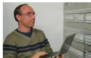
INNOXEL ist auch nach dem Verkauf für Kunden da