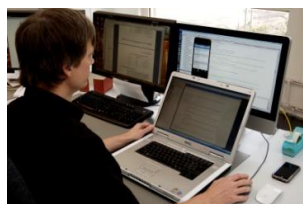
Soft- und Hardware werden inhouse entwickelt